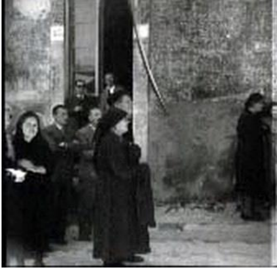
Figura 27: sorteggio