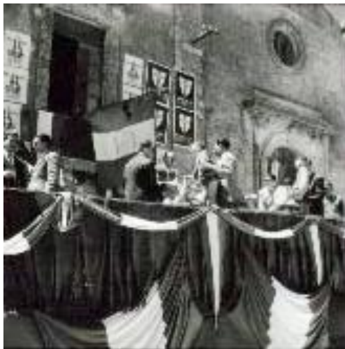
Figura 9: sorteggio