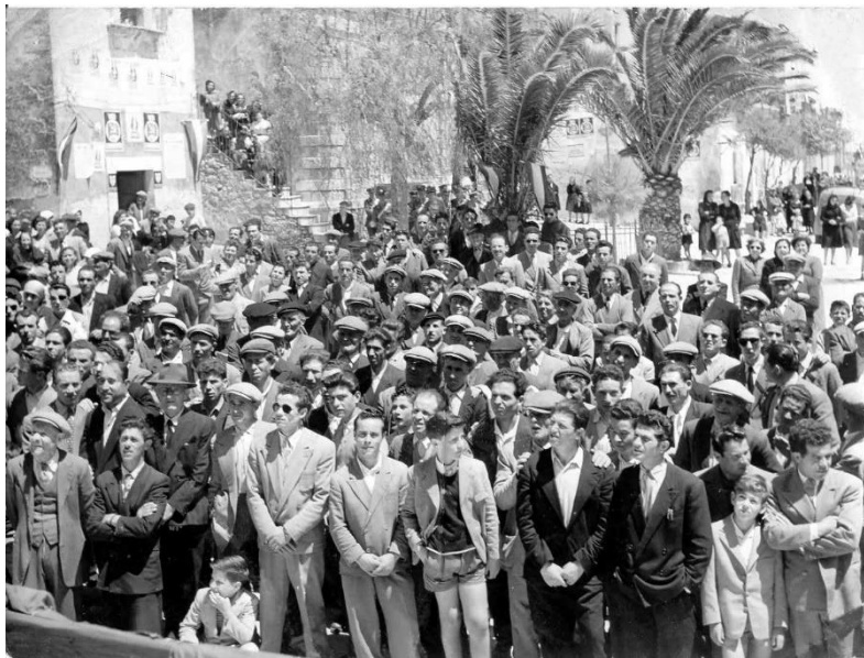
Figura 29: sorteggio