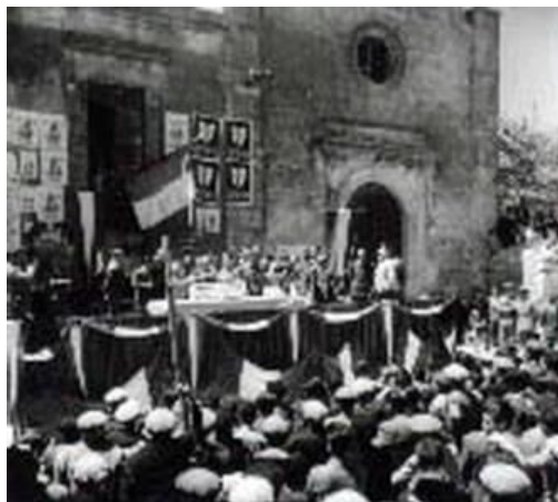
Figura 10: sorteggio