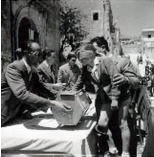
Figura 15: sorteggio