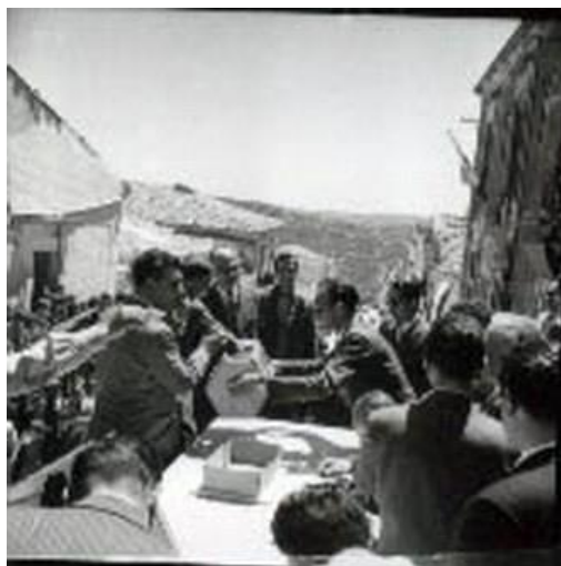
Figura 24: sorteggio