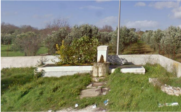
Figura 5: Abbeveratoio