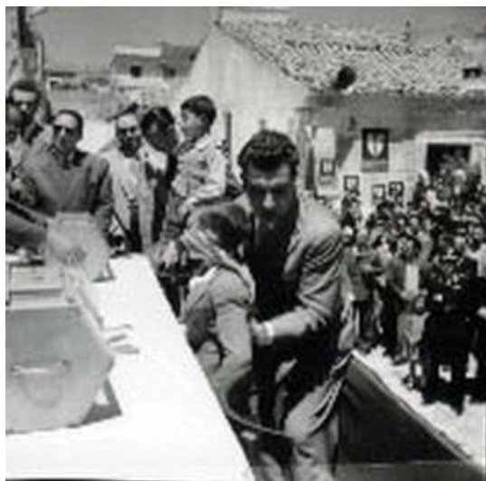
Figura 13: sorteggio