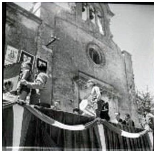
Figura 11: sorteggio