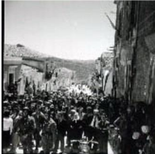
Figura 18: sorteggio