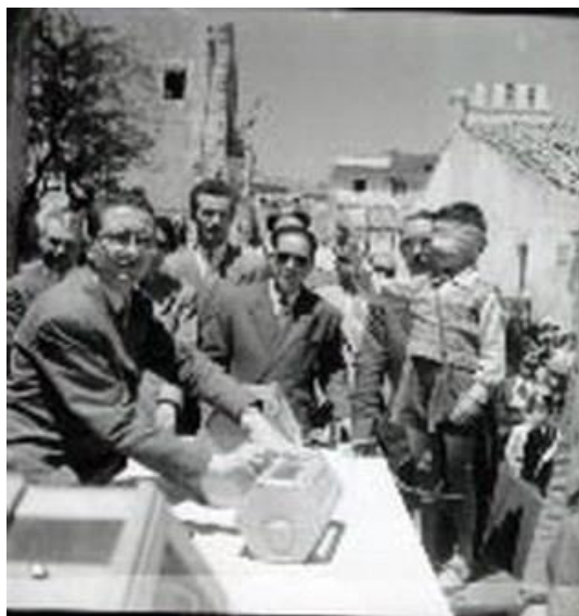
Figura 14: sorteggio