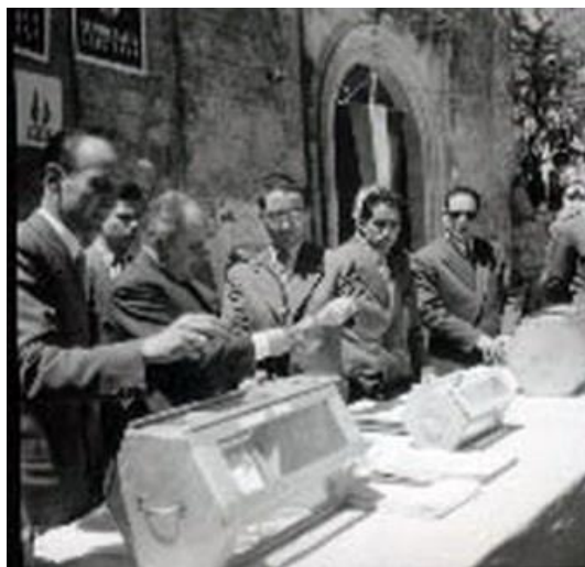
Figura 12: sorteggio