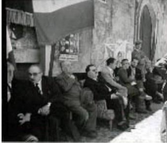
Figura 25: sorteggio