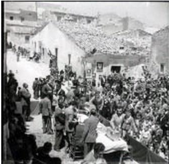
Figura 28: sorteggio