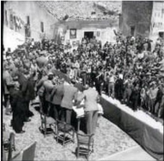
Figura 26: sorteggio