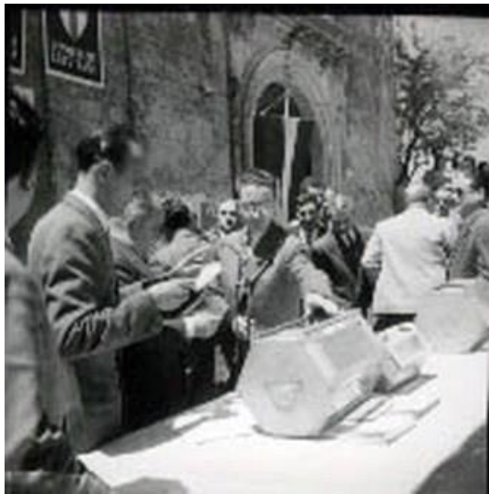
Figura 16: sorteggio