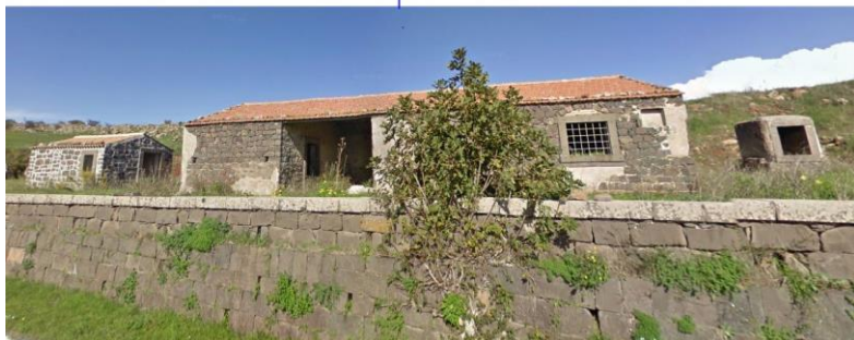
Figura 2: Casa colonica