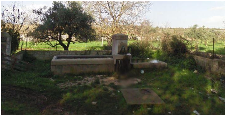
Figura 6: Abbeveratoio