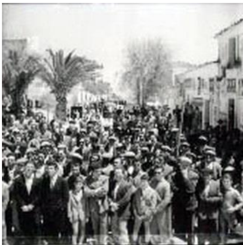
Figura 19: sorteggio