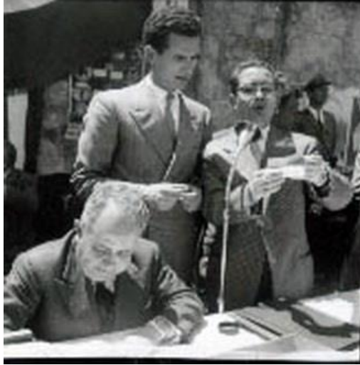
Figura 17: sorteggio