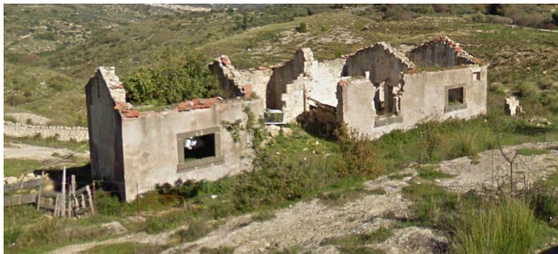
Figura 1: Casa colonica

Lungo la strada Cassaro – Cozzo Bianco abbiamo due esempi di Case Coloniche. La prima all'altezza della contrada Montagna in pessime condizioni. La seconda più avanti in condizioni migliori.