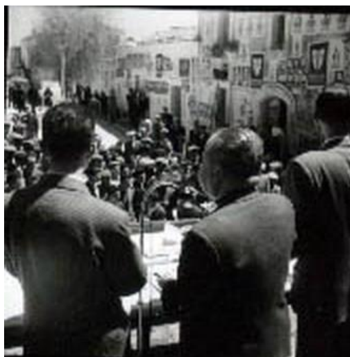
Figura 22: sorteggio