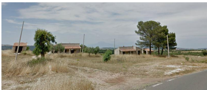
Figura 4: Unità abitative

Lungo la strada provinciale furono costruiti n. 4 abbeveratoi alimentati con l'acqua proveniente dalla sorgente Cava del Signore.