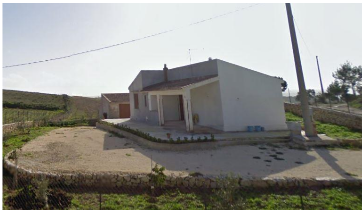
Figura 3: Unità abitativa