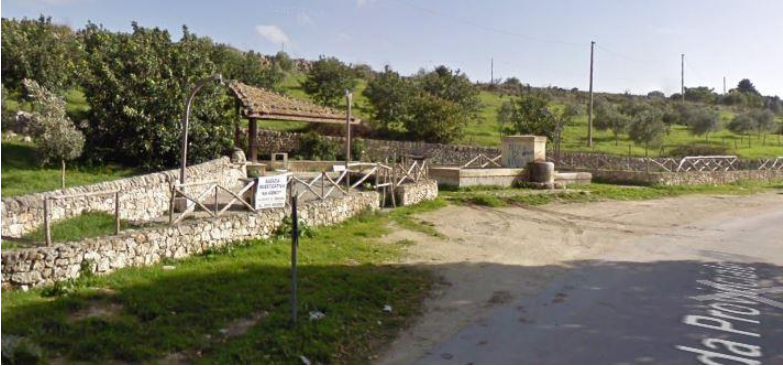
Figura 7: Abbeveratoio