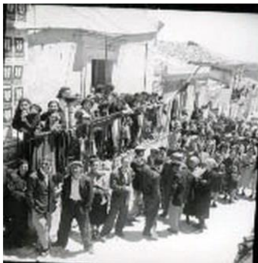
Figura 21: sorteggio