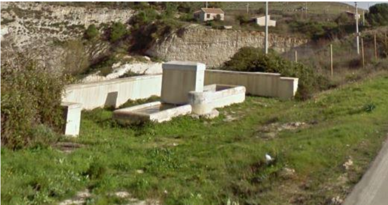
Figura 8: Abbeveratoio