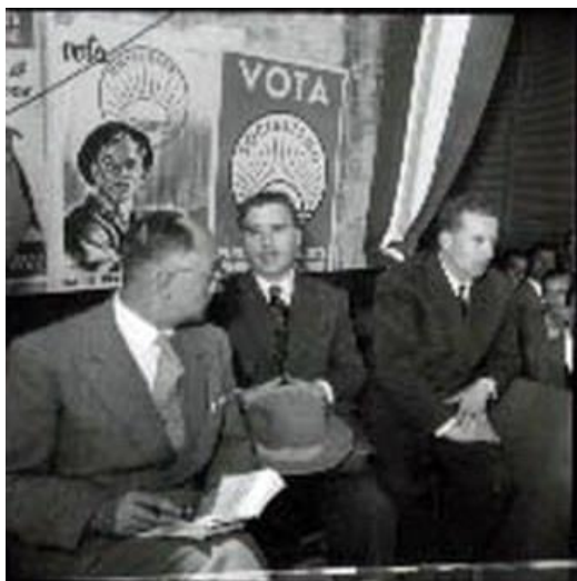
Figura 23: sorteggio