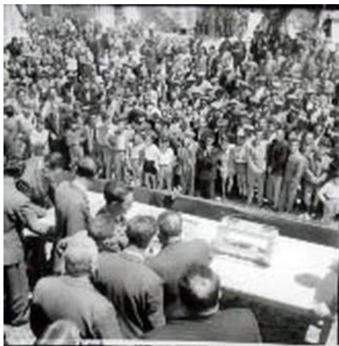
Figura 20: sorteggio