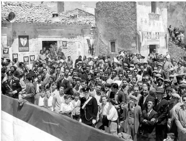
Figura 30: sorteggio